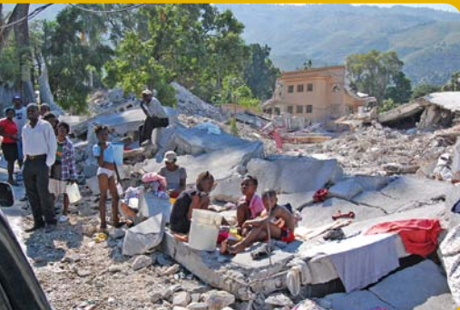
Zemětřesení na Haiti za sebou zanechalo 3 miliony lidí, kteří potřebují naši pomoc.