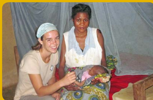
Třicet zdravotnických středisek v Kongo získalo porodní stoly a další vybavení pro bezpečný porod.