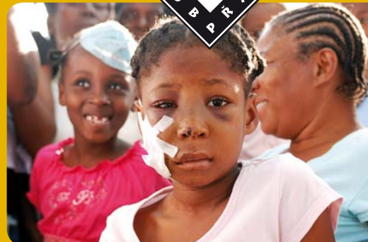
Pro děti připravujeme psychosociální podporu a další pomoc.