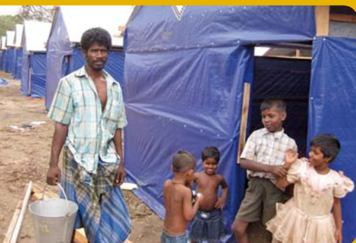
Na Srí Lance jsme vybudovali provizorní obydlí pro 150 rodin uprchlíků a zajistili pro ně pitnou vodu.

V Kongo jsme uspořádali šestitýdenní doučovací kurzy pro více než tisíc dětí uprchlíků. Vyučování dětí probíhá pouze v provizorních prostorách – pod širým nebem, v kostelech nebo narychlo stlučených budovách. Tři čtvrtiny dětí díky těmto kurzům složilo postupové zkoušky do dalšího ročníku školy.